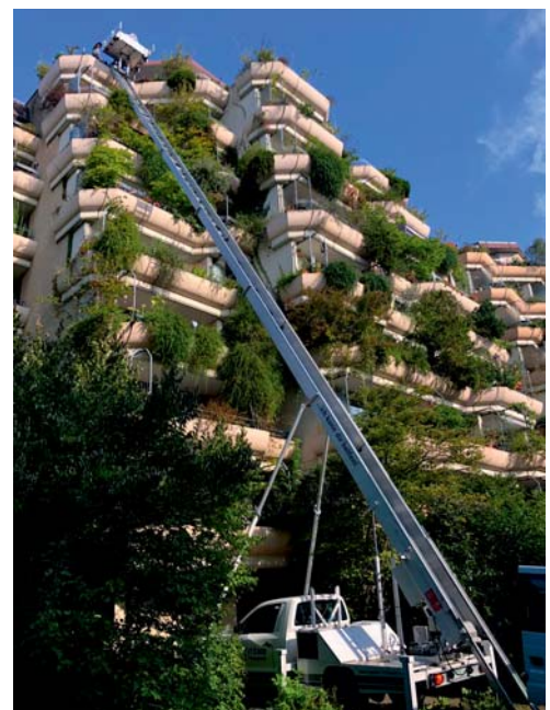
... und die Möbel mit unserem Lifter nach oben fahren.