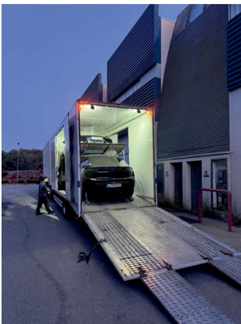
Wir können auch Ihre Garage umziehen...